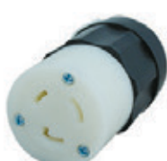
20A 125V 2P3H Nema L5-20R 2313