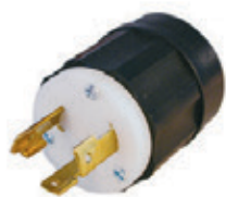
30A 125V 2P3H Nema L5-30P 2611