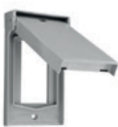
Placa termoplástica para GFCI o dispositivo Decora® montaje vertical