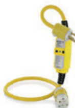
15A 120V Reset manual GFM15-3C