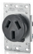
50A 125/250V 3P3H Nema 10-50R 5206*