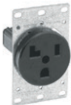
30A 125V 2P3H Nema 5-30R 5371*