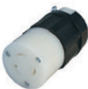
20A 250V 2P3H Nema L6-20R 2323