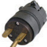
Clavija de hule EPTR 15A 250V 2P3H Nema 6-15P 615PR