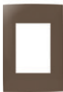
Chocolate 3 módulos CI4-PLA03-0WB