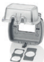
Placa transparente para receptáculo dúplex, sencillo o GFCI montaje horizontal