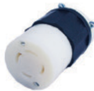
30A 3Ø 480V 3P4H Nema L16-30R 2733