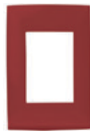
Rojo 3 módulos CI6-PLA03-0RE