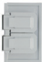
Placa termoplástica para receptáculo dúplex