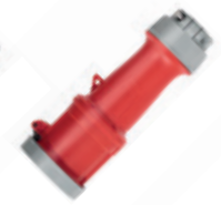
3Ø + T 480V 7H Conector 460C7WLEV