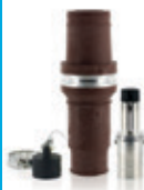
1135A 1000V Conector Macho Para cable 777MCM 49M77-H