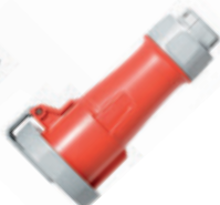
3Ø + T 480V 7H Conector 430C7WLEV