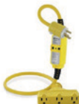
15A 120V Reset manual GFM15-3TC