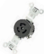
15A 125V 2P3H Nema L5-15R 4710*