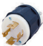
20A 3ØY 120/208V 4P4H No Nema 7411-C