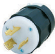
20A 277V 2P3H Nema L7-20P 2331