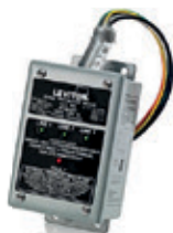
120/208V Delta o Estrella 80KA 42120-DY3