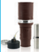
1135A 1000V Conector Hembra Para cable 777MCM 49F77-H