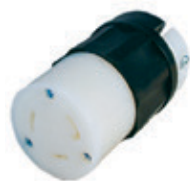
30A 125V 2P3H Nema L5-30R 2613