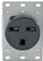
30A 250V 2P3H Nema 6-30R 5372*