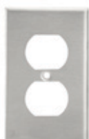
Placa de acero inoxidable para receptáculo dúplex 84003-40