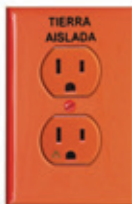
15A 125V TA 2P3H Nema 5-15R K13-05262-OIG