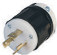
20A 250V 2P3H Nema L6-20P 2321