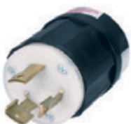
30A 3Ø 250V 3P4H Nema L15-30P 2721