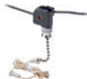
Interruptor de cadena on-off 1A 125V T, 1A 250V 10097-8