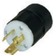
15A 250V 2P3H Nema L6-15P 4570-C