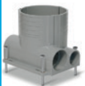
Caja de piso para concreto, con reductores accesorios y tapa con nivel burbuja FBBOX-GY