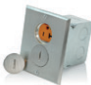
20A 125V Caja de piso con receptáculo dúplex TA 2P3H, caja, sellos, herrajes y placa de níquel 25349-IGN