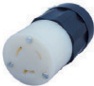
20A 277V 2P3H Nema L7-20R 2333