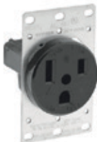
50A 125V 2P3H Nema 5-50R 5373*