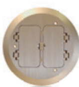
Placa con 2 tapas con bisagras tipo Decora® de latón FBC2F-B