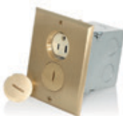
15A 125V Caja de piso con receptáculo dúplex 2P3H, caja, sellos, herrajes y placa de latón 25249-FBA