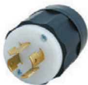
20A 125/250V 3P4H Nema L14-20P 2411