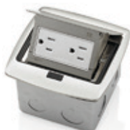
Receptáculo Dúplex TR 15Amp 001-PFTR1-0BR Latón 002-PFTR1-0BN Níquel 003-PFTR1-0MB Negro mate 004-PFTR1-0BZ Bronce