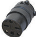
Conector de hule EPTR 15A 250V 2P3H Nema 6-15R 615CR