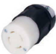
30A 3Ø 250V 3P4H Nema L15-30R 2723