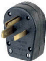
30A 125V/50A 125V Nema 5-30P y 5-50P 930