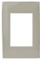
Gris 3 módulos CI7-PLA03-0WS