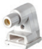
Base Slim Line deslizable macho 660W 1000V 2536