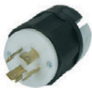
20A 3Ø 480V 3P4H Nema L16-20P 2431