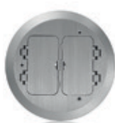
Placa con 2 tapas con bisagras tipo Decora® de níquel FBC2F-N