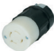
20A 3Ø 480V 3P4H Nema L16-20R 2433