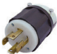
30A 3ØY 120/208V 4P4H No Nema 3431-C