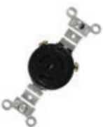
15A 250V 2P3H Nema L6-15R 4560*