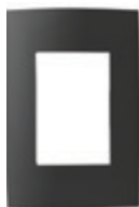
Negro mate 3 módulos CI3-PLA03-00B