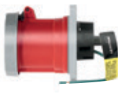
3Ø + T 480V 7H Receptáculo 460R7WLEV