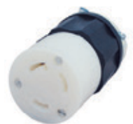
30A 250V 2P3H Nema L6-30R C2623