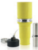
1135A 1000V Conector Hembra Para cable 777MCM 49F77-Y