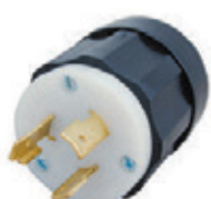
20A 125V 2P3H Nema L5-20P 2311