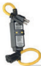
15A 120V Reset automático GFA15-2C