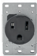
50A 250V 2P3H Nema 6-50R 5374*