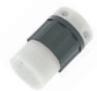
20A 3Ø 277/480V 4P5H Nema L22-20R 2523