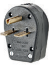
30A 250V/50A 250V Nema 6-30P y 6-50P 931