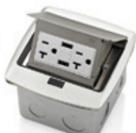
Receptáculo Dúplex TR 20Amp con 2 puertos USB 3.6A 001-PFUS2-0BR Latón 002-PFUS2-0BN Níquel 003-PFUS2-0MB Negro mate 004-PFUS2-0BZ Bronce