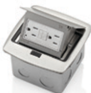
GFCI 15Amp 001-PFGF1-0BR Latón 002-PFGF1-0BN Níquel 003-PFGF1-0MB Negro mate 004-PFGF1-0BZ Bronce