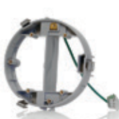
Anillo de nivelación para caja de piso para concreto FBLEV-GY