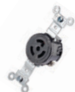
15A 277V 2P3H Nema L7-15R 4760*