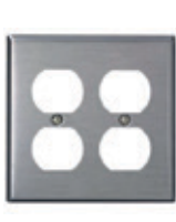
Placa de acero inoxidable para 2 receptáculos dúplex 84016-40