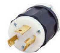
30A 250V 2P3H Nema L6-30P 2621