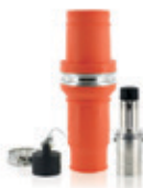
1135A 1000V Conector Macho Para cable 777MCM 49M77-O