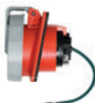
3Ø + T 480V 7H Receptáculo 430R7WLEV