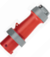
3Ø + T 480V 7H Clavija 460P7WLEV