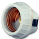
Portalámpara de porcelana con clip 660W 250V 8875