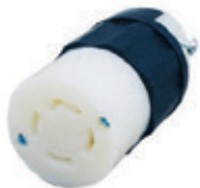
30A 125/250V 3P4H Nema L14-30R 2713