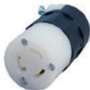
15A 125V 2P3H Nema L5-15R 4729-C