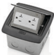
Receptáculo Dúplex TR 20Amp 001-PFTR2-0BR Latón 002-PFTR2-0BN Níquel 003-PFTR2-0MB Negro mate 004-PFTR2-0BZ Bronce