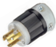
15A 277V 2P3H Nema L7-15P 4770-C