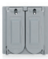
Placa metálica de 2 gang para 2 receptáculos dúplex GFCI o sencillos