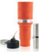
1135A 1000V Conector Hembra Para cable 777MCM 49F77-O