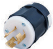
20A 125/250V 3P3H No Nema 9965-C