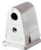
Base Slim Line deslizable hembra 660W 600V 2537