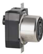
50A 250VDC/600VAC 3P4H No Nema 7379**