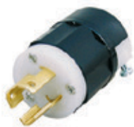
15A 125V 2P3H Nema L5-15P 4720-C