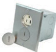
15A 125V Caja de piso con receptáculo dúplex 2P3H, caja, sellos, herrajes y placa de níquel 25249-SBA