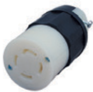
30A 3ØY 120/208V 4P4H No Nema 3433-C