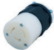
20A 125/250V 3P3H No Nema 7314-C