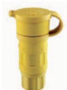
15A 250V 2P3H Nema L6-15R 25W49