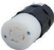
20A 125/250V 3P4H Nema L14-20R 2413