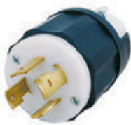
30A 3Ø 480V 3P4H Nema L16-30P 2731