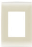
Marfil 3 módulos CI1-PLA03-MAR