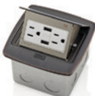
Receptáculo Dúplex TR 15Amp con 2 puertos USB 3.6A 001-PFUS1-0BR Latón 002-PFUS1-0BN Níquel 003-PFUS1-0MB Negro mate 004-PFUS1-0BZ Bronce