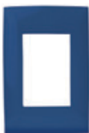
Azul 3 módulos CI5-PLA03-0RN