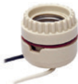
Portalámpara de porcelana de 2 piezas 660W 250V 8101