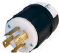
30A 125/250V 3P4H Nema L14-30P 2711