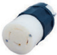
20A 3ØY 120/208V 4P4H No Nema 7413-C