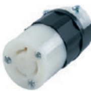
15A 250V 2P3H Nema L6-15R 4579-C