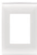
Blanco 3 módulos CI0-PLA03-BLA