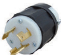
30A 125/250V 3P3H No Nema 3331-C