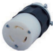
30A 125/250V 3P3H No Nema 3333