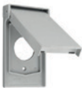
Placa termoplástica p/receptáculo sencillo de media vuelta de 20A o 30A de 40mm de diámetro