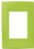
Verde manzana 3 módulos CI8-PLA03-0GS