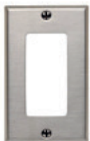
Placa Decora® de acero inoxidable 84401-40