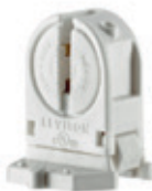
Portalámpara fluorescente T5 120W 600V 13654-SWP