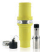
1135A 1000V Conector Macho Para cable 777MCM 49M77-Y