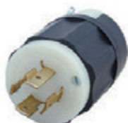
20A 3Ø 250V 3P4H Nema L15-20P 2421