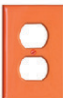
Placa de nylon para receptáculo dúplex 80703-ORG