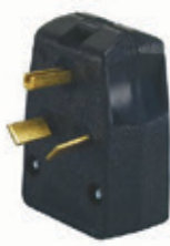
30A y 50A 125/250V Nema 10-30P y 10-50P 287-T

*Se colocan con la placa de acero inoxidable de 2.15" (54mm) de diámetro Cat. 84028