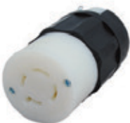
20A 3Ø 250V 3P4H Nema L15-20R 2423