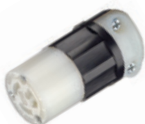
15A 277V 2P3H Nema L7-15R 4779-C