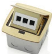
3 puertos Quick port 001-PFQP3-0BR Latón 002-PFQP3-0BN Níquel 003-PFQP3-0MB Negro mate 004-PFQP3-0BZ Bronce