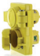
15A 125V 2P3H Nema 5-15R 80W47-D