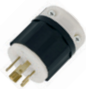
20A 3Ø 277/480V 4P5H Nema L22-20P 2521