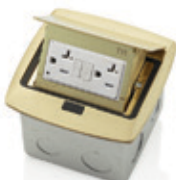
GFCI 20Amp 001-PFGF2-0BR Latón 002-PFGF2-0BN Níquel 003-PFGF2-0MB Negro mate 004-PFGF2-0BZ Bronce