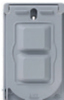
Placa metálica para receptáculo dúplex, sencillo o GFCI montaje vertical