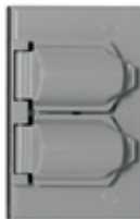
Placa metálica para receptáculo dúplex