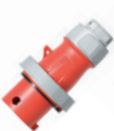
3Ø + T 480V 7H Clavija 430P7WLEV